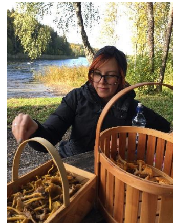
Svampplockning på hösten

Leden fortsätter söderut mot Bråviken och vi passerar ett klapperstensfält uppe på höjden. Det ser ut som en ås där jättar i forntid spelat kula. Tusentals klot ligger som ett hav uppe på bergshöjden. En senare dag i veckan ska vi få uppleva ett liknande men ännu mäktigare klapperstensfält.