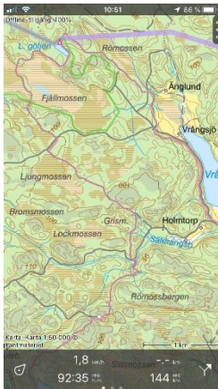
Hämta kartan i mobilen