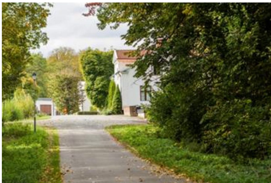
Stavsjö Herrgårdsflygel.

När eftermiddagen nu närmar sig behöver vi fundera på "bryggan" till nästa dag. Flera alternativ finns. Under sommarhalvåret ligger Vildmarkshotellet på Djurparken nära till. Men vi har kanske redan inkvarterat oss i Stavsjö Herrgårdsflygel, tio kilometer norrut. Stavsjö Herrgårdsflygel är ett litet livsstilshotell som är öppet året runt. Geografiskt ligger hotellet idealiskt placerat för alla de vandringar vi ska göra den här veckan.